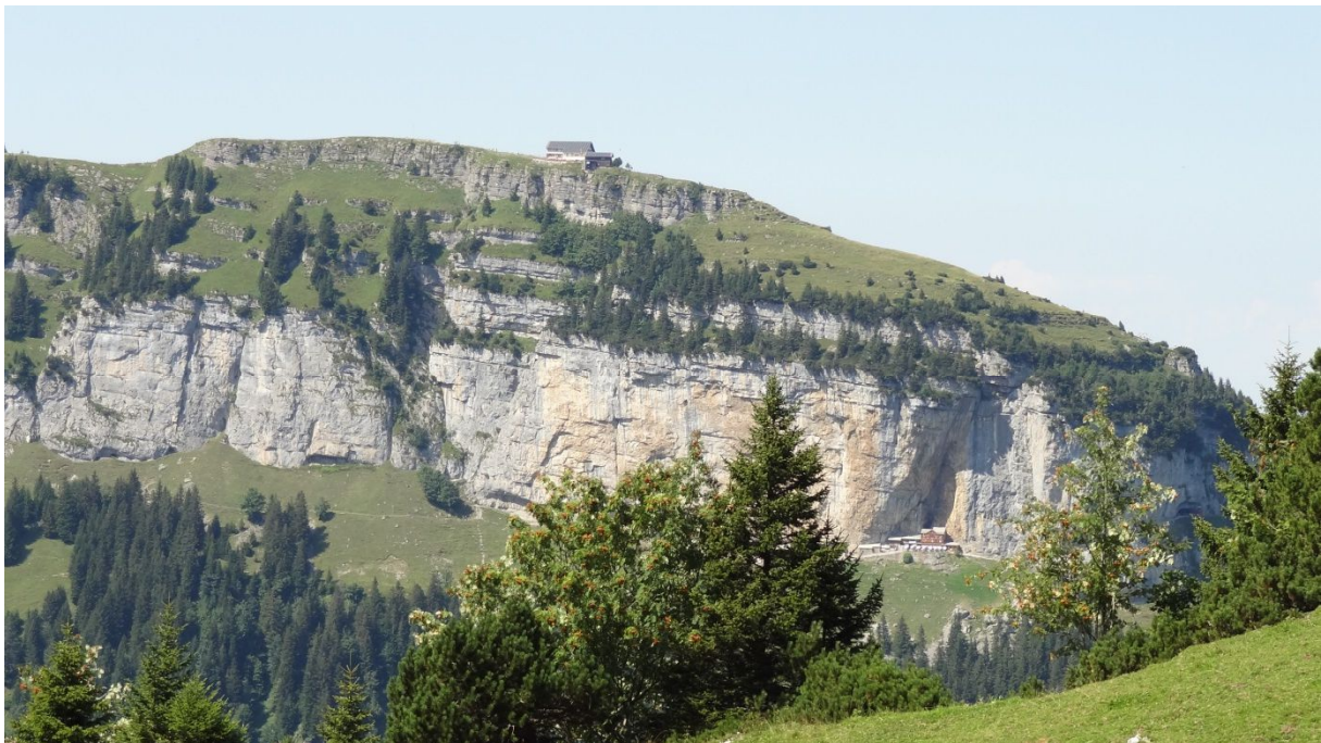
Bergstation Ebenalp und Äscher Wildkirchli